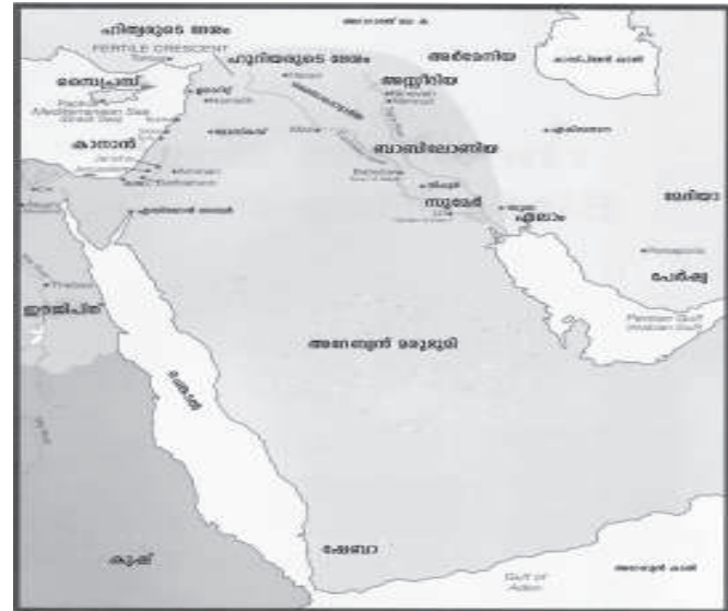
മധ്യപൂർവ്വദേശം എസെക്കിയേലിന്റെ കാലഘട്ടത്തിൽ