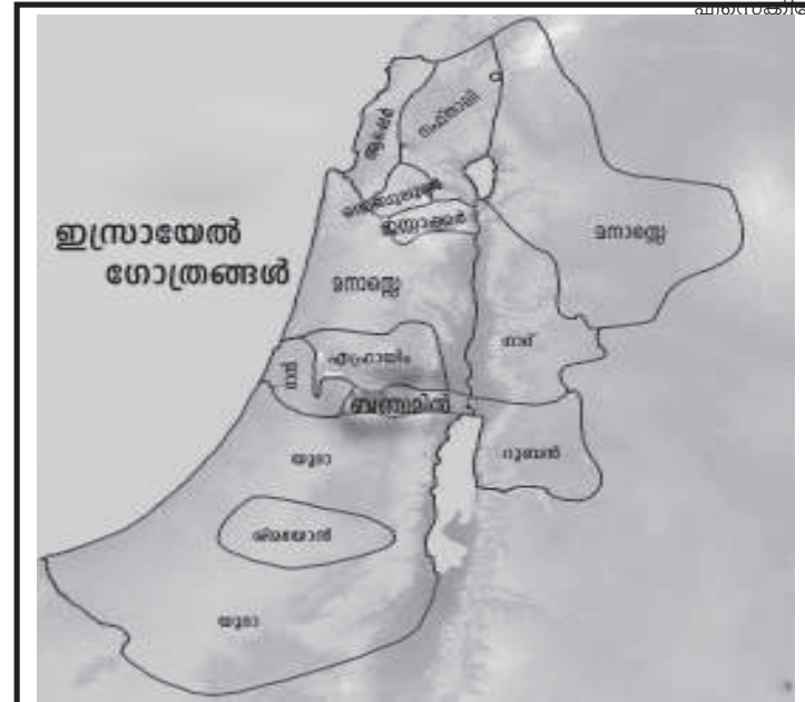
ഇസ്രായേലിന്റെ പന്ത്രണ്ടു ഗോത്രങ്ങൾക്കായുള്ള ദേശവിഭജനത്തിലെ വ്യത്യാസം നിയമഗ്രന്ഥത്തിന്റെയും (മുകളിൽ) എസെക്കിയേലിന്റെ ഗ്രന്ഥത്തിന്റെയും ദൃഷ്ടിയിൽ

ഇസ്രായേലിലെ ഗോത്രങ്ങളുടെ എണ്ണത്തെക്കുറിച്ച് സമാനാഭിപ്രായമില്ല. ദബോറയുടെ ഗീതത്തിൽ (ന്യായാ 5) പത്തു ഗോത്രങ്ങളുടെ പേരുകളുണ്ട്. ഇവിടെ യൂദാ, ലേവി, ശിമയോൻ തുടങ്ങിയ ഗോത്രങ്ങളില്ല. മോശയുടെ അനുഗ്രഹമനുസരിച്ച് പതിനൊന്നു ഗോത്രങ്ങളുണ്ട് (നിയ 33). യാക്കോബിന്റെ അനുഗ്രഹത്തിൽ പന്ത്രണ്ടു ഗോത്രങ്ങൾ കാണാം (ഉൽപ 49). സംഖ്യയുടെ പുസ്തകവും പന്ത്രണ്ടു ഗോത്രങ്ങളെക്കുറിച്ചു പരാമർശിക്കുന്നുണ്ട് (1:20-43; 26:5-50).